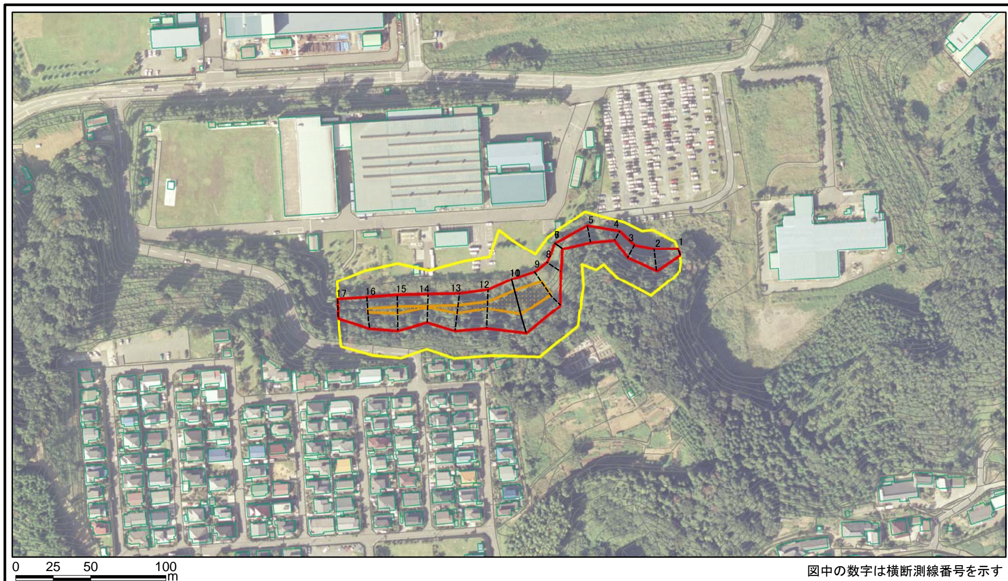
図中の数字は横断測線番号を示す