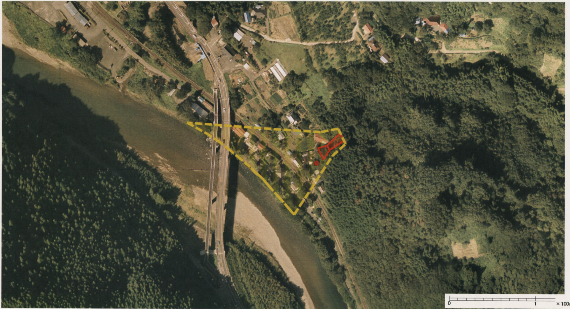
様式-3 (土) 土砂災害警戒区域・土砂災害特別警戒区域 区分図 (その2)