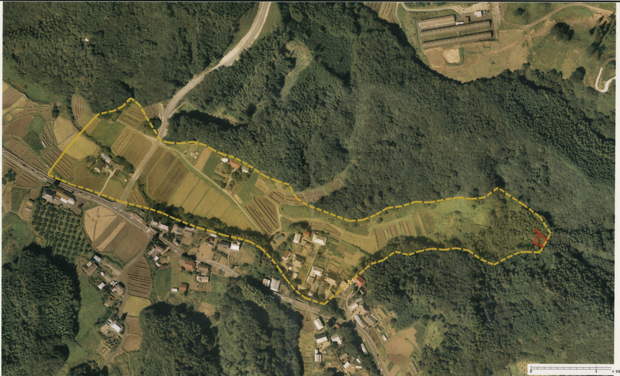
様式-3 (土) 土砂災害警戒区域・土砂災害特別警戒区域 区分図 (その3)