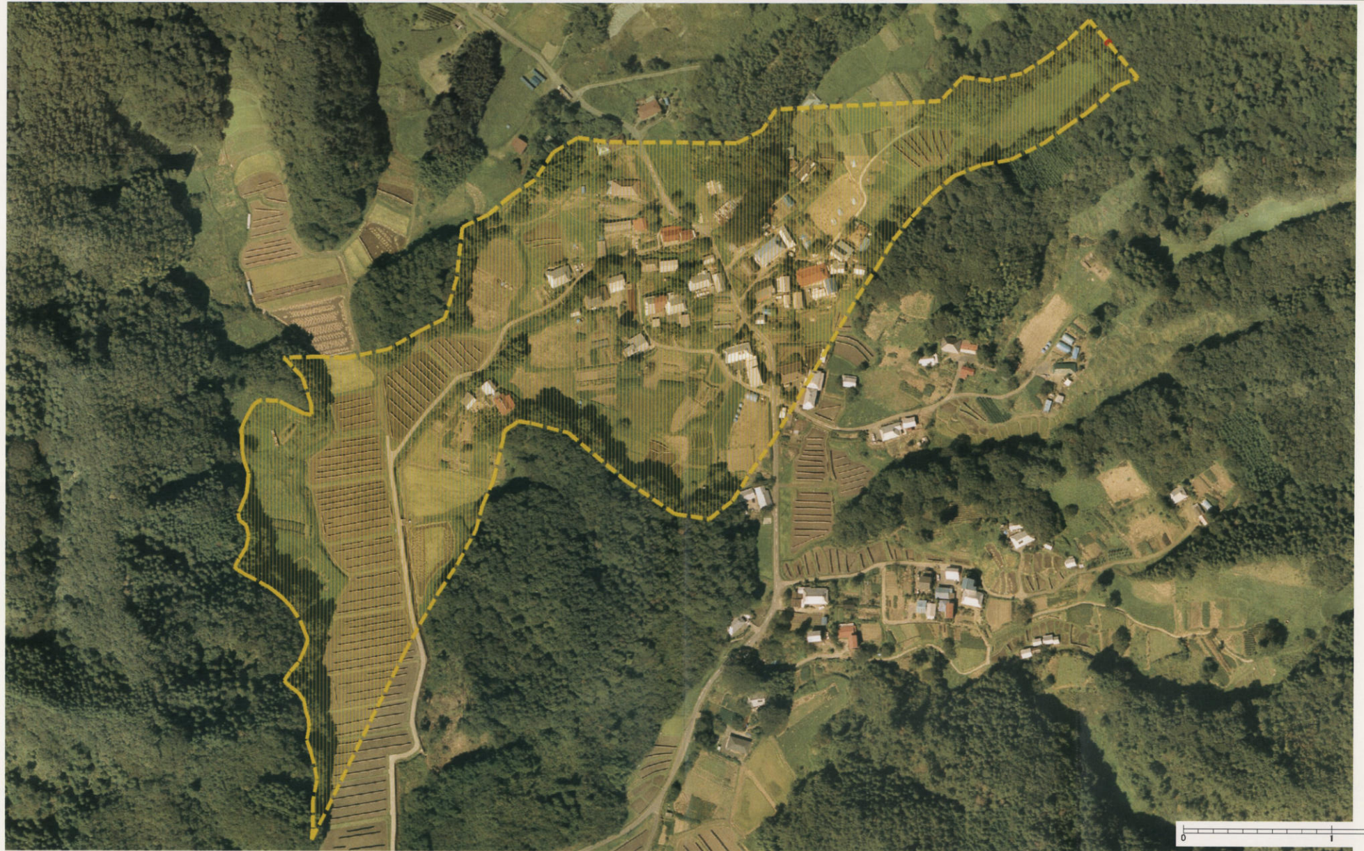
様式-3 (土) 土砂災害警戒区域・土砂災害特別警戒区域 区分図 (その3)