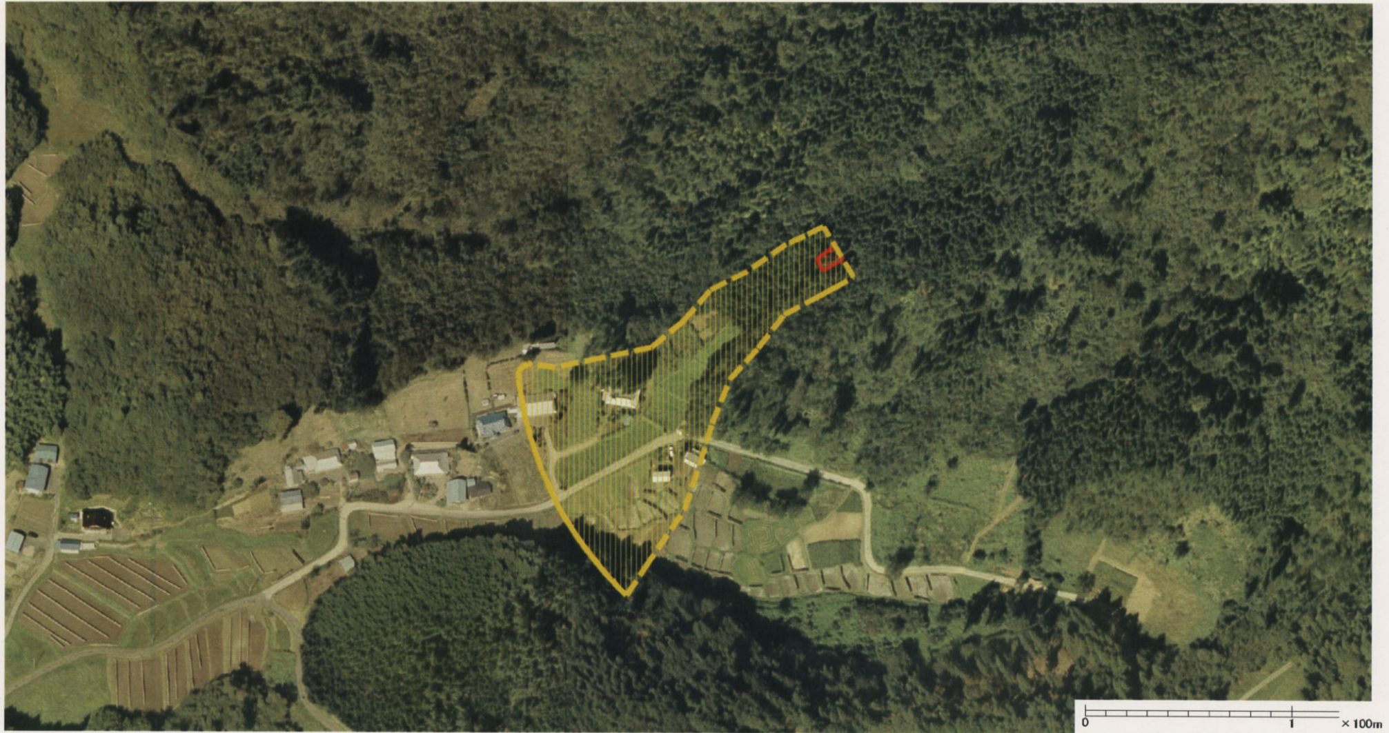
様式-3 (土) 土砂災害警戒区域・土砂災害特別警戒区域 区分図 (その2)