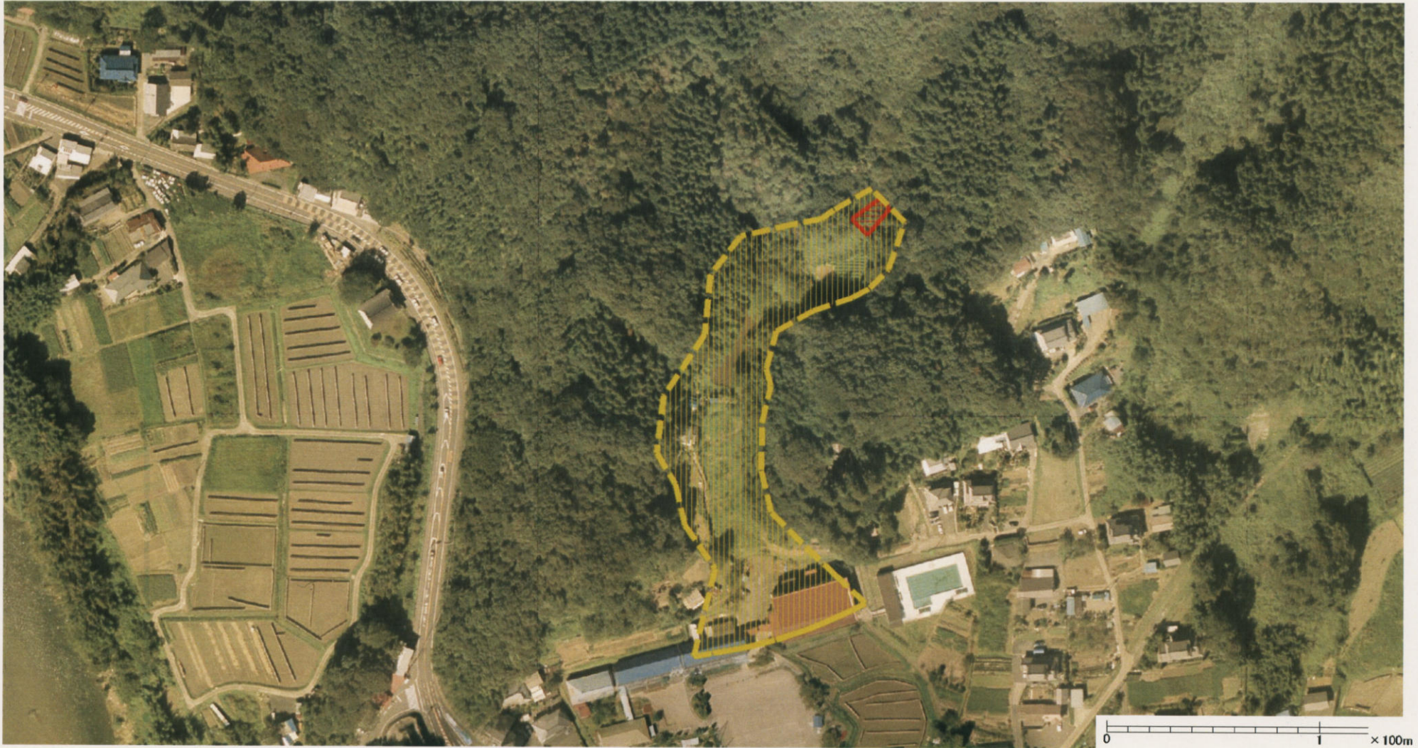
様式-3 (土) 土砂災害警戒区域・土砂災害特別警戒区域 区分図 (その2)