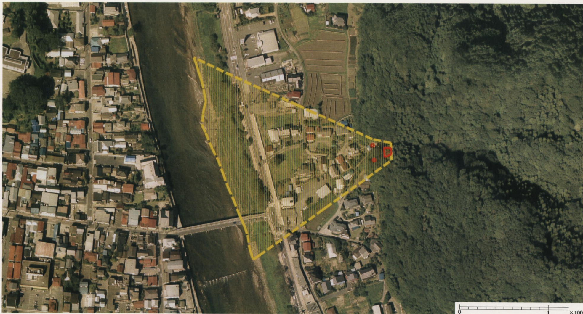
様式-3 (土) 土砂災害警戒区域・土砂災害特別警戒区域 区分図 (その2)