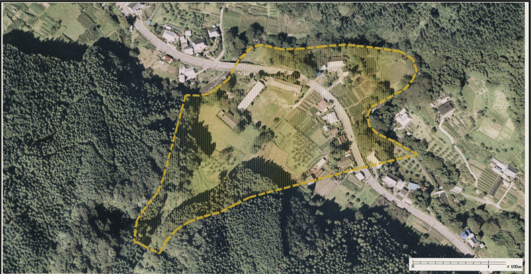
様式-3 (土) 土砂災害警戒区域・土砂災害特別警戒区域 区分図 (その2)