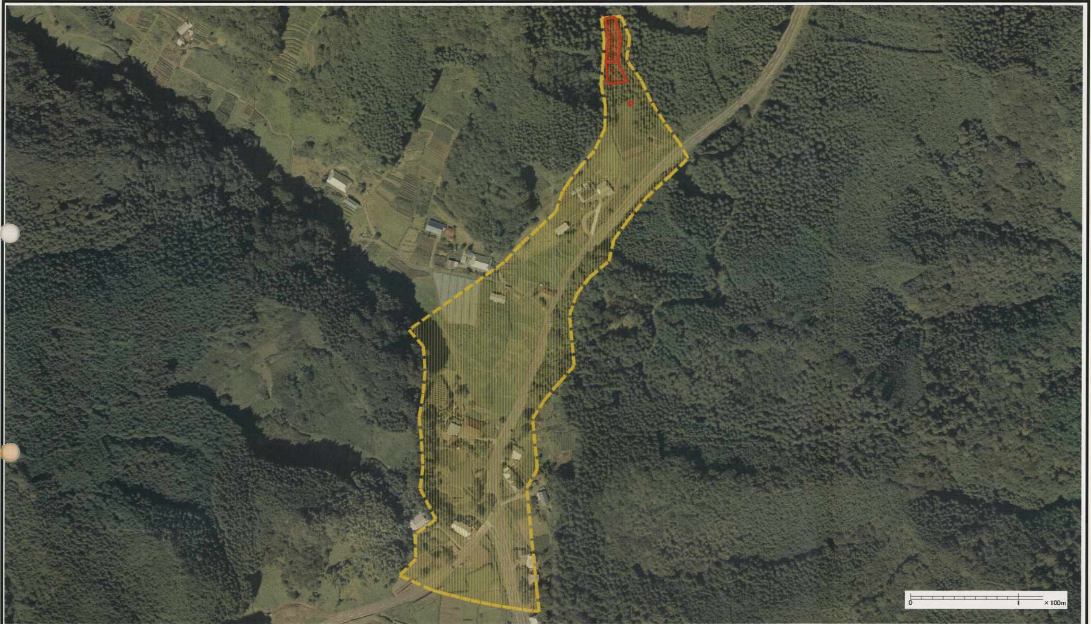
様式-3 (土) 土砂災害警戒区域・土砂災害特別警戒区域 区分図 (その3)