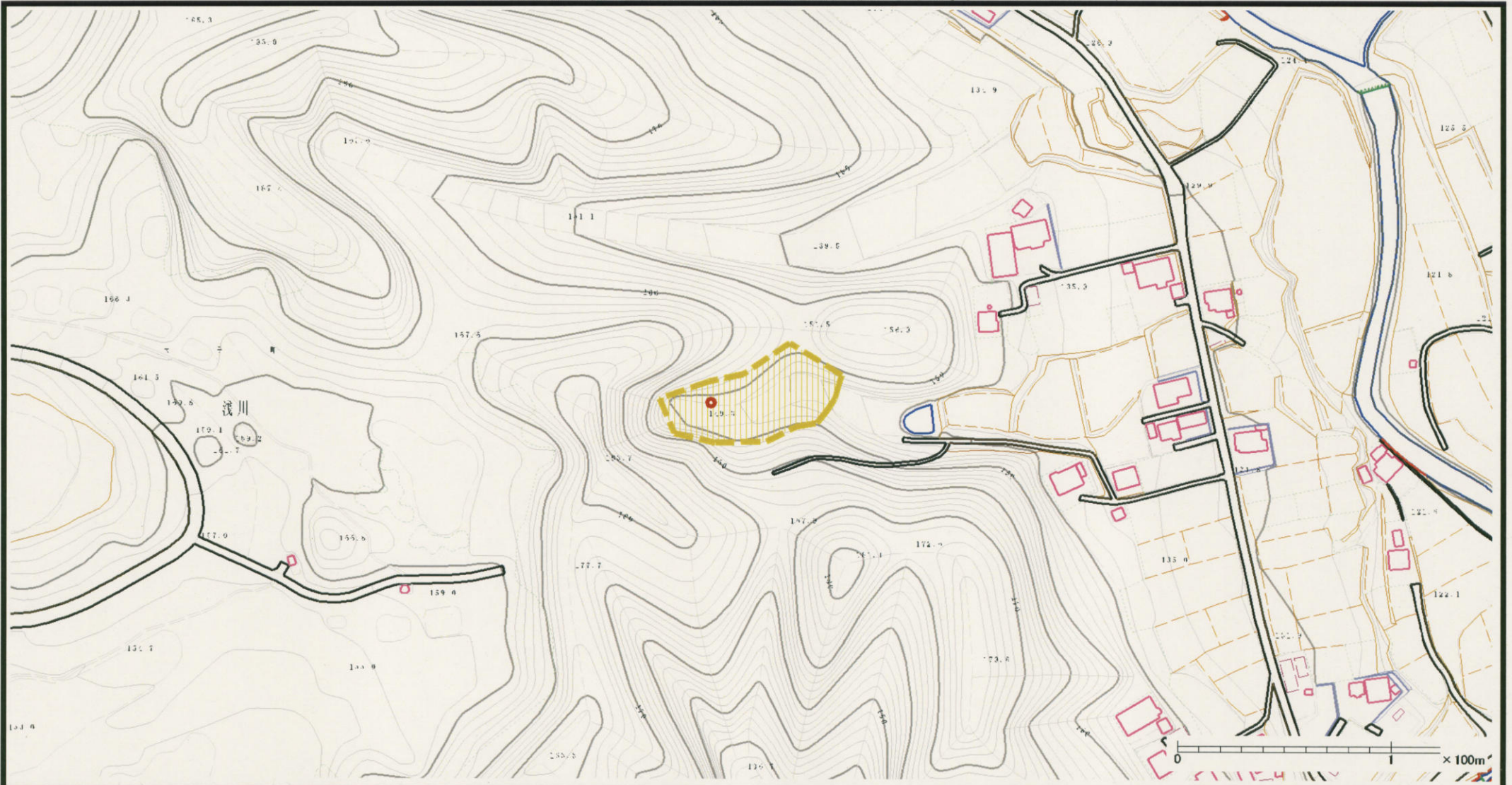
様式-2 (土) 土砂災害警戒区域・土砂災害特別警戒区域 区分図 (その1)