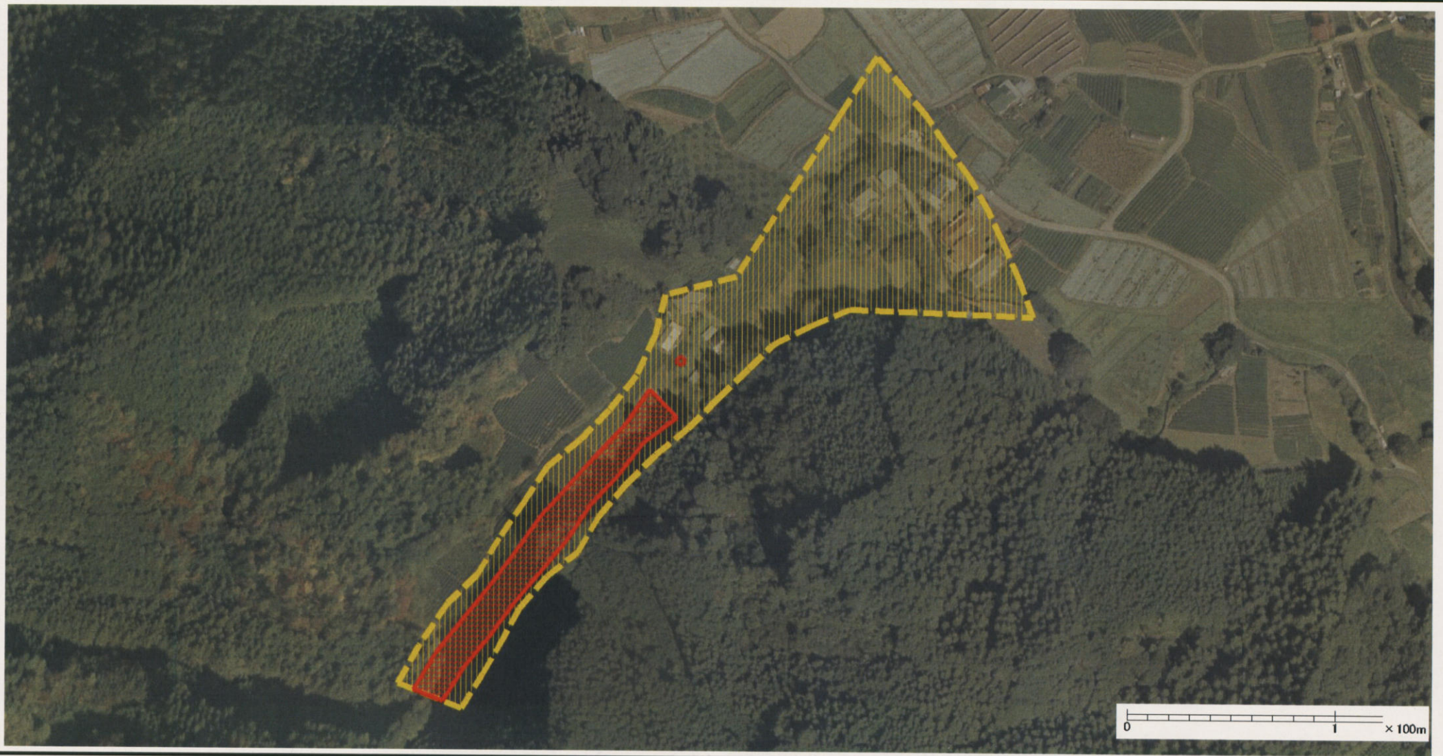
様式-3 (土) 土砂災害警戒区域・土砂災害特別警戒区域 区分図 (その2)