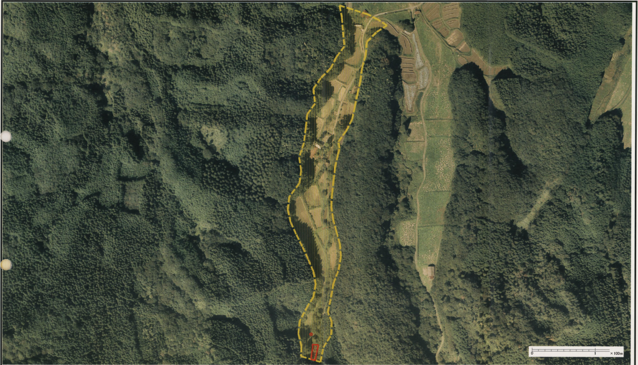
様式-3(土) 土砂災害警戒区域・土砂災害特別警戒区域 区分図(その3)