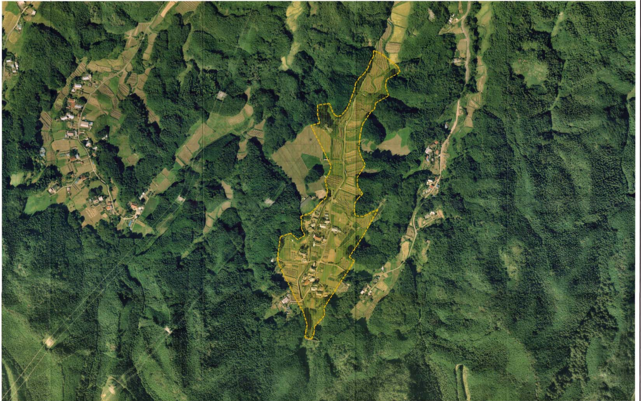
様式-3 (土) 土砂災害警戒区域・土砂災害特別警戒区域 区分図 (その3)