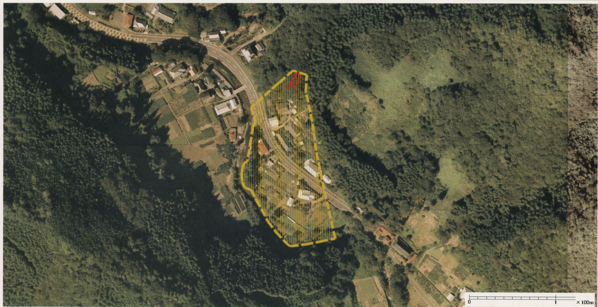
様式-3 (土) 土砂災害警戒区域・土砂災害特別警戒区域 区分図 (その2)