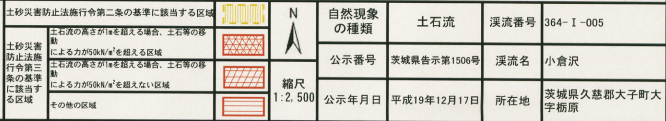
様式-2 (土) 土砂災害警戒区域・土砂災害特別警戒区域 区分図 (その1)