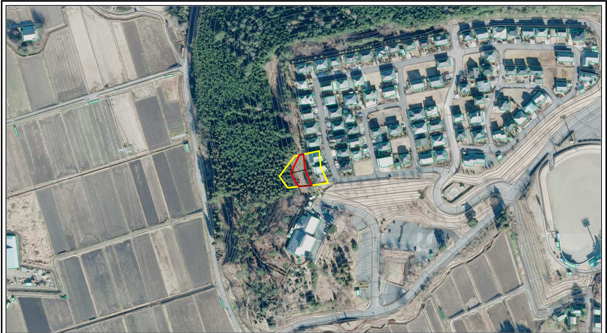
図中の数字は横断測線番号を示す