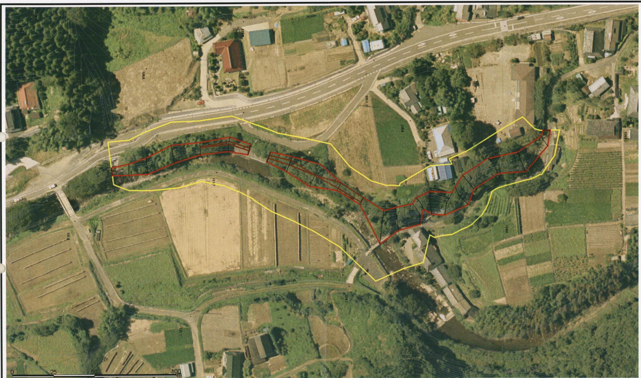
様式-3(急) 土砂災害警戒区域・土砂災害特別警戒区域 区域図(その2)