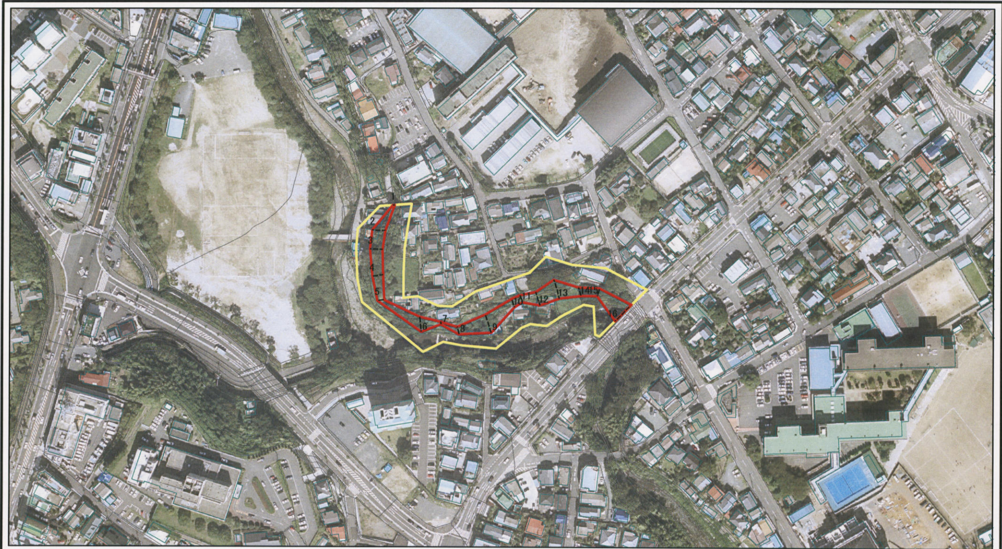
図中の数字は横断測線番号を示す