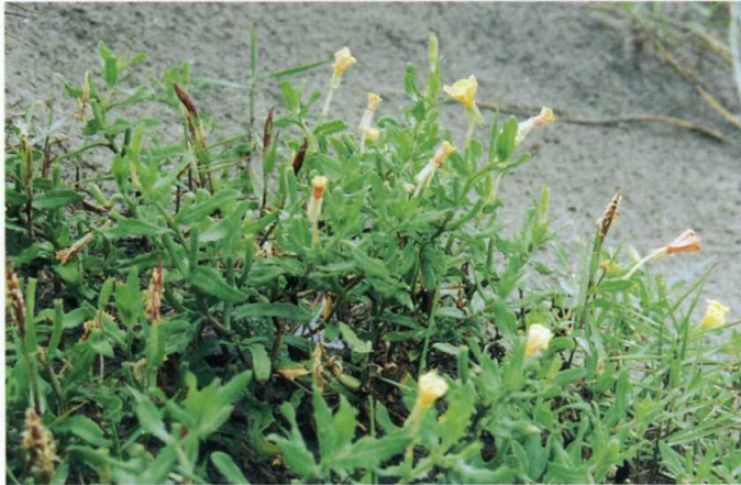
コマツヨイグサ アカバナ科

ほふく性の落葉低木。枝にはとげがある。葉は7~9枚の小葉からなり、厚く光沢がある。5~7月に3cmほどの白色の花をつけ果実は秋に赤く熟す。河原や山野にも生えるが、海岸部では鹿嶋などでみることがきる。