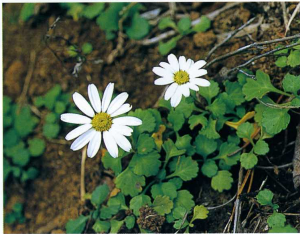
コハマギク キク科

高さ50～100cmの多年草または小低木。茎は太く基部からそう生し、葉は肉質で表面に光沢がある。9～11月に6cmほどの白い花をつける。北茨城、高萩では比較的ふつうにみられるが、ひたちなか市が分布の南限となっている。