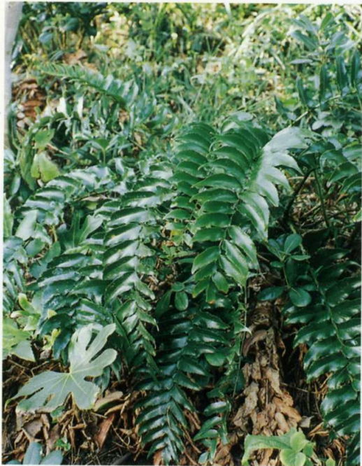
オニヤブソテツ オシダ科

高さ20～60cmの多年草。茎は直立しやや角張る。葉は厚く光沢があり多数つく。6～8月、茎頂に橙赤色の花を上向きにつける。花弁の間に隙間があるのでこの名が付いた。砂浜にも生育し、県内のほぼ全域に分布する。