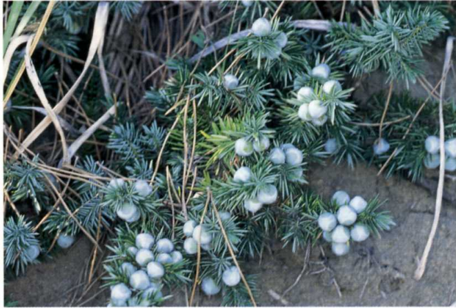
ハイネズ ヒノキ科

常緑低木。幹は分枝して地をはい四方に広がる。葉は先がとがり触れると痛い。4~5月、前年の枝に花をつける。果実は直径1cmほどで熟すと紫黒色に粉白をおびる。伊師など砂浜海岸のクロマツ林縁で見られる。