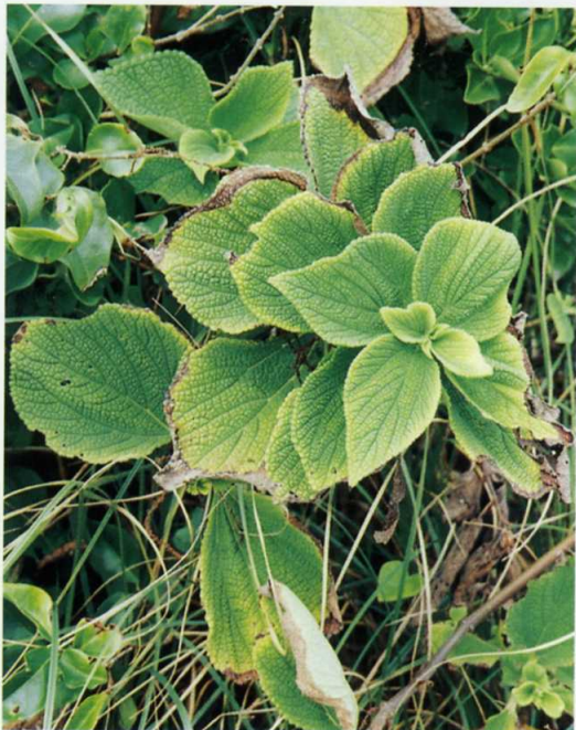
ラセイタソウ イラクサ科

長さ60～100cmになる常緑多年性のシダ植物。葉は濃緑色で光沢があり厚い革質。根茎は塊状となる。常磐沿岸に多くみられる。