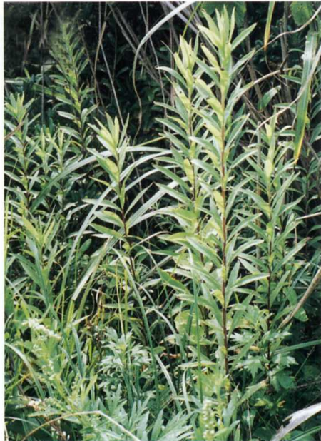
セイトカアワダチソウ キク科

高さ20~60cmの越年草。茎は斜上するか地面に伏し、葉は浅く切れ込む。幼苗はロゼット葉で越冬する。花期は7~8月で葉のわきに淡黄色の花をつける。花はしぼむと赤黄色になる。北米原産の帰化植物で乾いた砂地に生える。波崎、鹿嶋などで多くみられる。