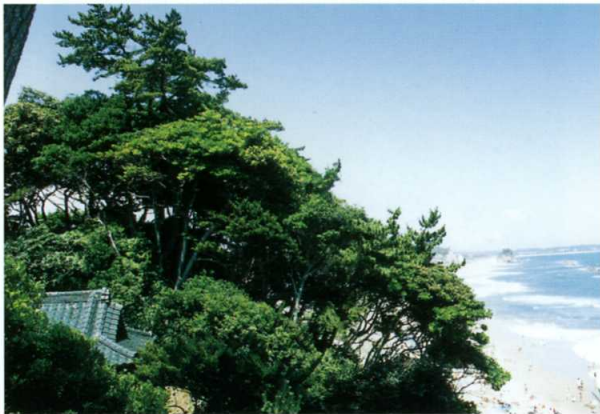
タブノキ クスノキ科

高さ3mほどの常緑低木。葉は革質で光沢があり長さ4~7cm。6~7月に葉のつけねから短い柄を出し、淡緑色の小花をつける。果実は秋に赤橙色に熟す。主に常磐沿岸に分布する。