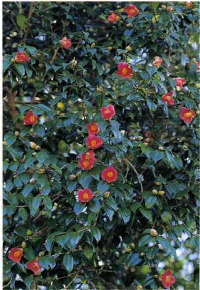
ヤブツバキ ツバキ科

高さ2~3mにもなる多年草。茎は直立し、葉は披針形で多数つく。10~11月、茎頂に黄色の小花を多数つける。地下茎から他の植物の生長を阻害する物質を分泌しながら繁殖する。北米原産の帰化植物で空地、荒地、土手などに群生する。