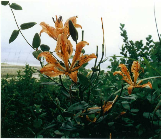
スカシユリ ユリ科

高さ20～60cmの多年草。茎は直立しやや角張る。葉は厚く光沢があり多数つく。6～8月、茎頂に橙赤色の花を上向きにつける。花弁の間に隙間があるのでこの名が付いた。砂浜にも生育し、県内のほぼ全域に分布する。