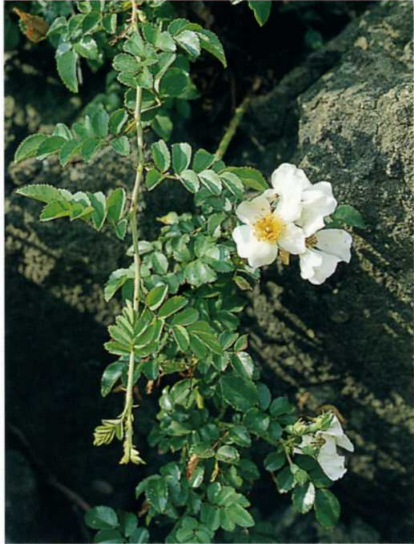
テリハノイバラ バラ科

常緑低木。幹は分枝して地をはい四方に広がる。葉は先がとがり触れると痛い。4~5月、前年の枝に花をつける。果実は直径1cmほどで熟すと紫黒色に粉白をおびる。伊師など砂浜海岸のクロマツ林縁で見られる。