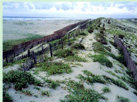
にっかわ 日川海岸 がみす (神栖町)