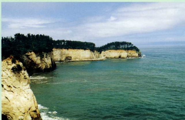
小貝浜海岸（日立市）

※特定植物群落とは「比較的ふつうに見られるものであっても南限や北限に分布している植物群落」、「郷土景観を代表する植物群落で、その特徴が典型的なもの」などの理由から、環境庁によって選定された植物群落のことです。