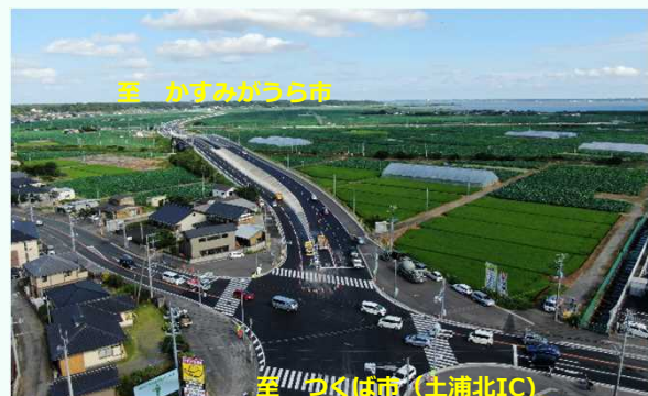
跨線橋前後の渋滞が解消され、 円滑な交通を確保