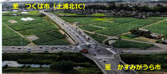
土浦北IC方面への アクセス強化