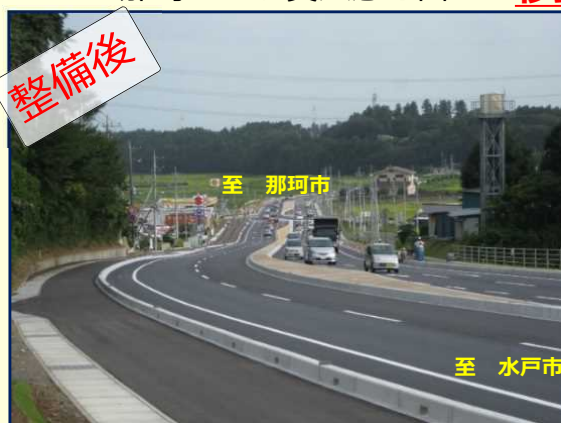
渋滞が解消され、円滑な交通確保