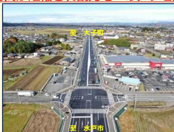
奥久慈方面へのアクセス強化