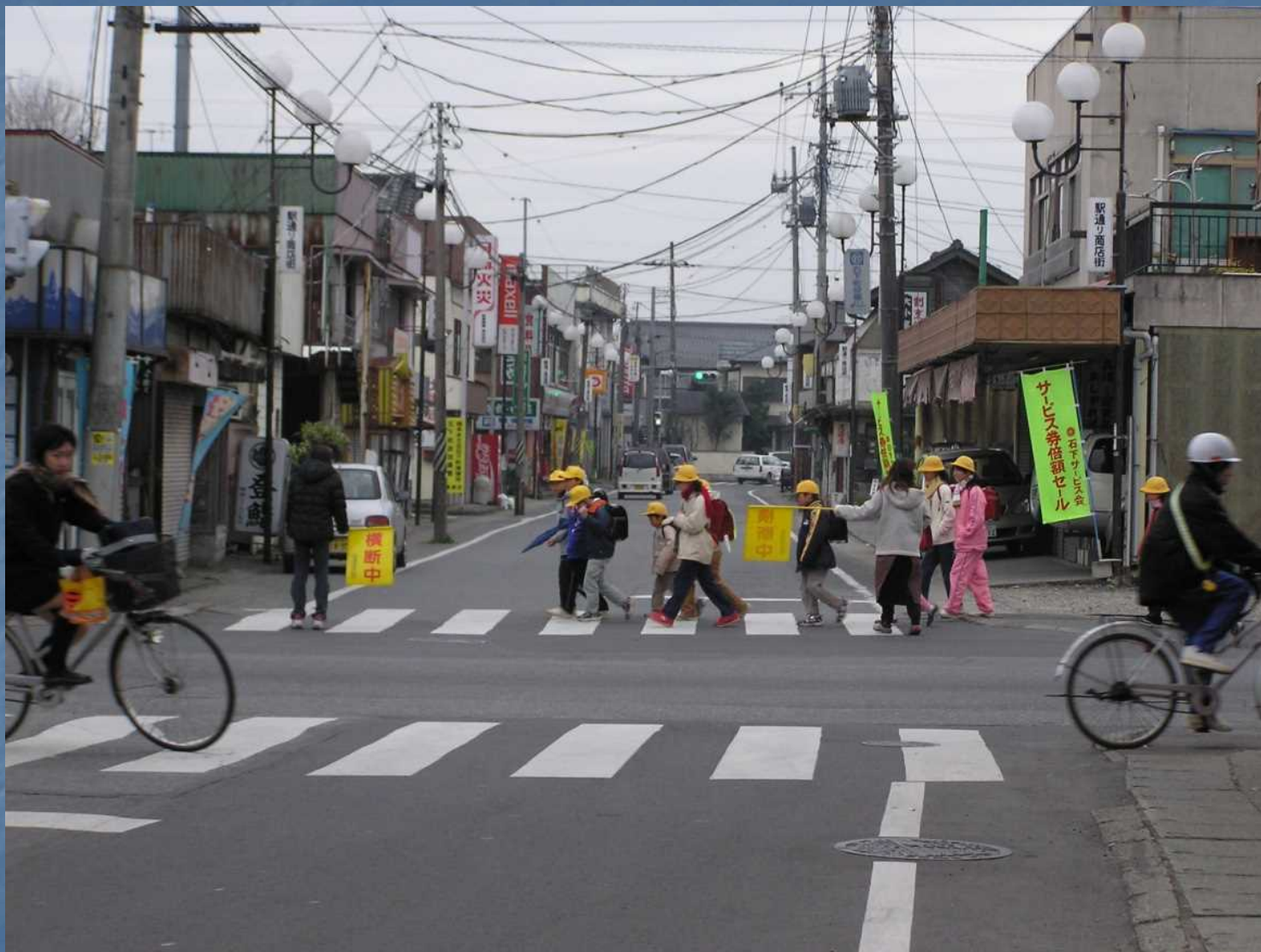
商店街区間の状況