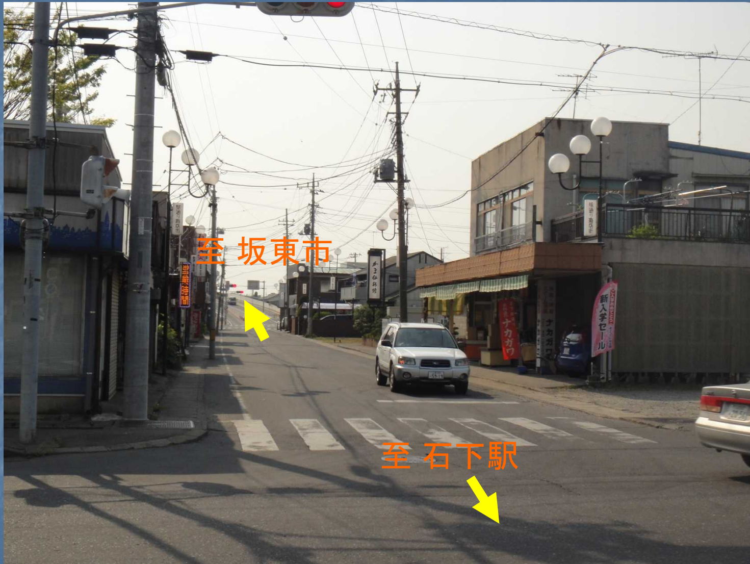
事業区間〔石下駅商店街の状況〕