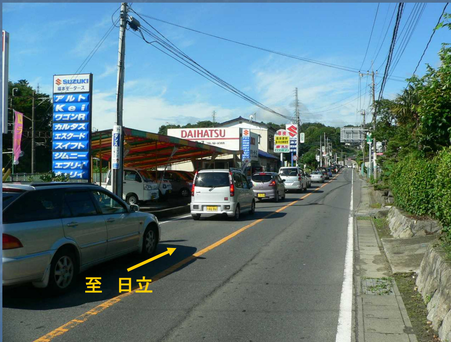
現道の状況(十王駅付近)