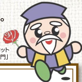
茨城県のマスコット「ハッスル黄門」

今月は、各県の旬の情報をそれぞれの広報紙で紹介する「北関東3県連携企画」として、栃木県・群馬県の観光情報も併せてご紹介します。各県を巡っているいろいろな秋を楽しんでみませんか。