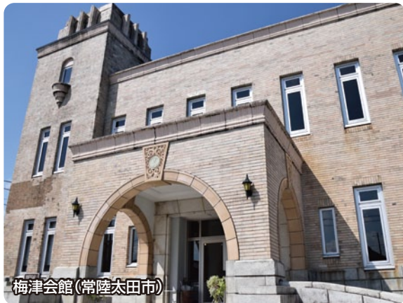
梅津会館(常陸太田市)