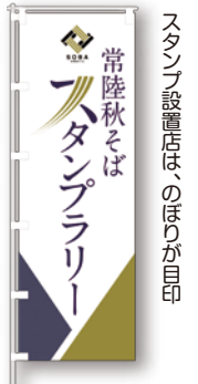
スタンプ設置店は、のほりが目印

問 県北振興課 ☎029(301)2725 📍「常陸秋そばスタンプラリー」「常陸秋そばフェア」で検索