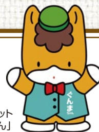
群馬県のマスコット 「ぐんまちゃん」