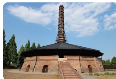
美しい造形が特徴の野木町煉瓦窯