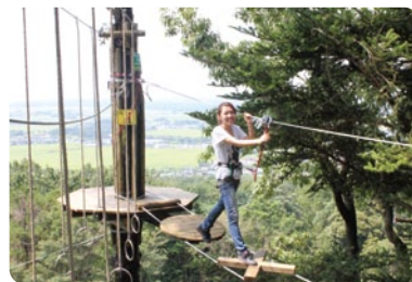
迫力満点のアクティビティ

☎ フォレストアドベンチャー・つくば ☎090(4755)7800 つくば市沼田1688