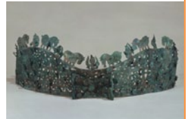
こんどうせいりまがたかざりつけかんわり 「金銅製馬形飾付冠」 (当館蔵)

(入館料)一般600円、大学生310円、高校生以下無料 水戸市緑町2-1-15 ☎029(225)4425 FAX029(228)4277