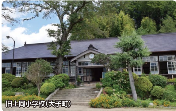
旧上岡小学校(大子町)