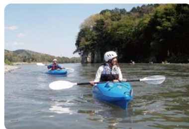
那珂川でのカヌー体験

☎ ストームフィールドガイド ☎090(6505)2544 常陸大宮市野口1151