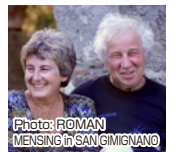
イリヤ& エミリア・カバコフ 「落ちてきた空」 1995/2016

お問い合わせ先 茨城県北芸術祭実行委員会 県東北振興課内 事務局：☎0296(301)2222 現地事務所：☎02964(2)1121 ✉ kenpoku-art@pref.ibaraki.jp 「茨城県北芸術祭」検察