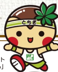
栃木県のマスコット 「とちまるくん」