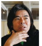
日比野 克彦 bigdatana - たなはものすみか 2015 東京都美術館