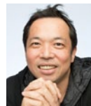
原 高史 「Signs of Memory」 2010