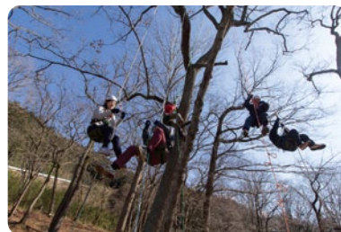
ツリークライミング