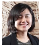
ジョン・ヘリオン Abstract Time - Amore 2013