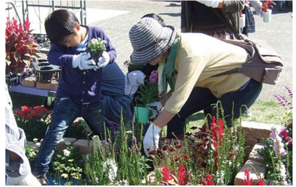
チャレンジ・ガーデニングの様子

10月は「都市緑化月間」です。県民の皆さんに楽しみながら都市緑化の大切さを感じていただけるよう、各公園でさまざまなイベントを企画しています。