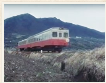
筑波山麓を走る筑波線

しかし、車社会の到来などにより、1987(昭和62)年3月31日にその歴史に幕を閉じました。筑波線の線路跡は、現在、通称つくばりんりんロード(一般県道桜川土浦自転車道線)として整備され、多くの方に親しまれるサイクリングロードとなっています。