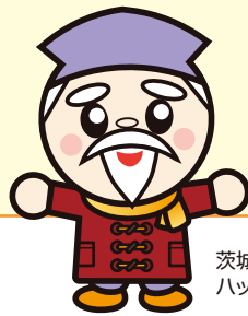
茨城県マスコット ハッスル黄門