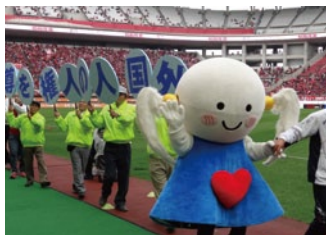
人権啓発活動 Jリーグと提携した活動