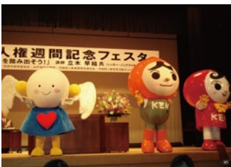
人権週間記念フェスタ 講演やミニコンサートの実施