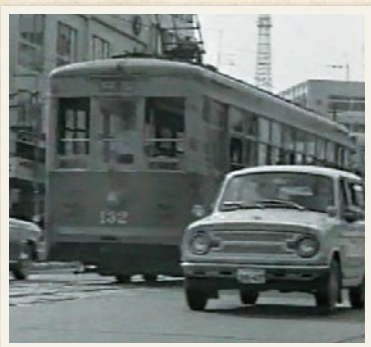
水戸の街中を走る水浜線

チンチン電車の愛称で市民に親しまれた水浜線でしたが、バスやタクシーの増加による利用者の減少などにより、1966(昭和41)年5月31日にその歴史に幕を閉じました。