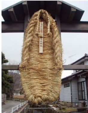
桜井五味田地区の八日祭(桜川市)

私たち日本人にとって「まつり」は特別なものです。家族や地域のみなどと一緒に折り、そして祝う、ハレの舞台です。今回は、私たちの暮らしと深く結びついた年中行事や祭礼の中から、茨城の地で行われてきた特色ある秋の祭りや冬の祭りを紹介します。