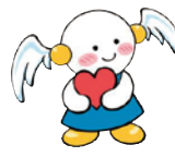
人権啓発キャラクター ココロちゃん

誰もが健やかに、幸せに暮らしていくためには、一人一人が優しさや思いやりの心を持ち、互いに尊重することが大切です。