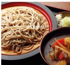
つかけんちんそば

「玄そばの最高峰」とも言われる「常陸秋そば」のスタンプラリーを開催中です。抽選で300名様に、県北地域の特産品をプレゼント!