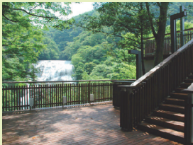
昨年9月に完成した新観瀑台からは、滝の全景を見ることができます