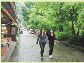
袋田の滝までの道のりを、散策しながらウォーキング

県民文化センターの小ホール(定員460人)を埋め尽くした観衆は、講演や発表に熱心に聞き入っていました。