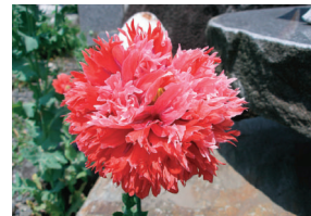
ケシ(ソムニフェルム種)