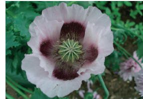
アツミゲシ(セティゲルム種)

不正大麻・けし撲滅運動 (4月20日～7月末) 近くにこんな花は見かけませんか。 法律による栽培・所持などの禁止を知らずに不正栽培していることがあります。疑わしい花を見つけた場合は、県業務課・お近くの保健所までご連絡ください。 ☎ 県業務課 029(301)3388 FAX 3399