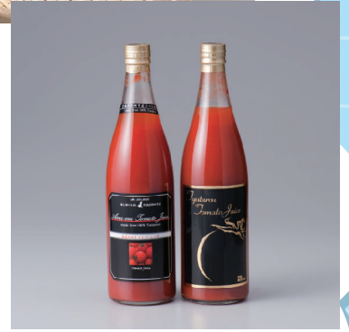
「あまエル」・「ちゅう太郎」 トマトジュース