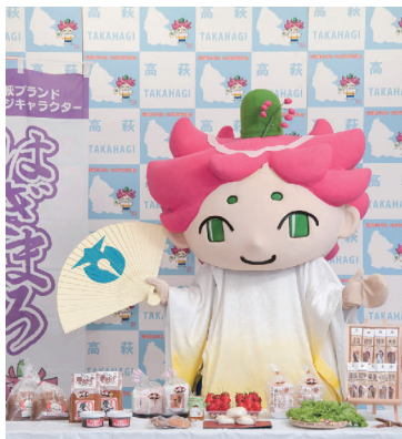
高萩ブランドを紹介する「はぎまる」

また、市の花である萩の花をモチーフにしたイメージキャラクターの「はぎまる」が、「げんき」「やる気」「輝き」を振りまきながら高萩ブランドのPRを行っています。