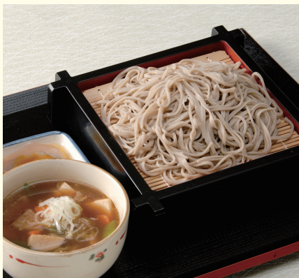
茨城を代表する郷土料理の一つ、「つけけんちんそば」

茨城県は、生産量全国第二位（平成十九年度）を誇るそばの一大産地になっています。その中でも、本県自慢の「常陸秋そば」は、常陸太田市（旧金砂郷町地域）で古くから栽培されていたそばの中から、県の農業研究所が優れたものを選び、育成した品種です。 常陸秋そばの特色は、粒ぞろいが良く、そば特有の香り・風味・甘味があることです。全国のそば職人の方から、高い評価を得て「日本一」との呼び声も聞かれるほどです。 そばは、栄養価も高い上、高血圧や動脈硬化の予防に効果があるとされるルチンを豊富に含む健康食です。県では本年度よりのぼりとプレートで「常陸秋そば使用店」を紹介しておりますので、本県が誇る常陸秋そばをご賞味ください。