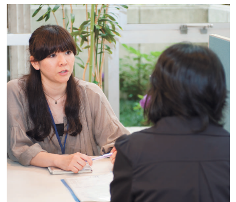
雇用に関するさまざまな相談を受け付けます

資格や経験がなくて自信がないという方でも、カウンセリングやセミナーで自分の長所や短所を知ること