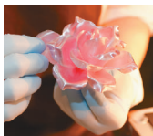
ピエスモンテ(アメ細工)

この職種では、ピエスモンテ(工芸菓子)・アントルメ(デコレーションケーキ)・マジパン(※)細工の3つの課題において、味やデザイン、加工技能などを競います。