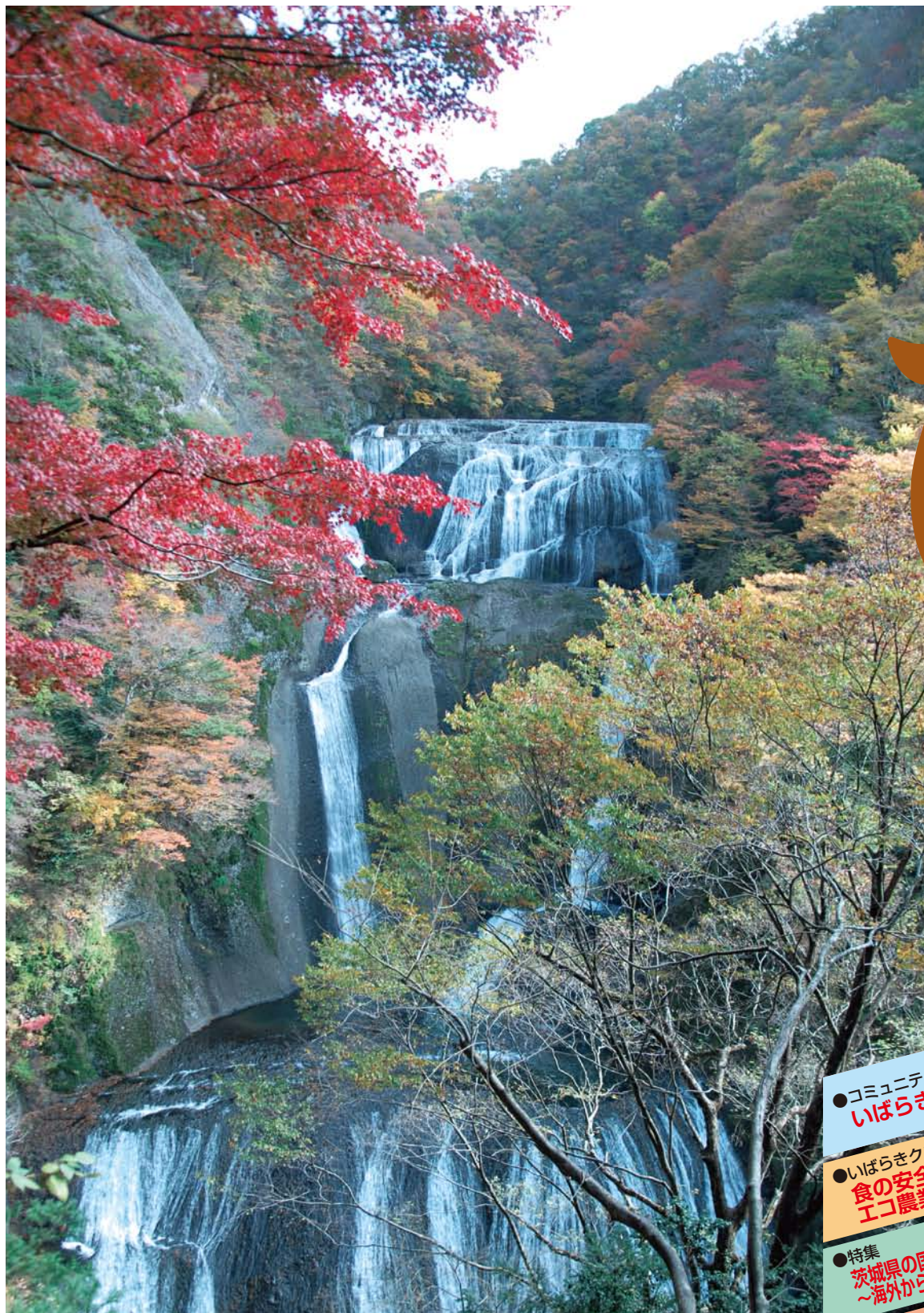
袋田の滝(大子町) 大子町観光商工課 ☎0295(72)1138