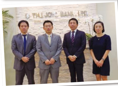
シンガポール駐在員事務所のスタッフ