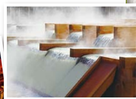
草津温泉 河鹿橋(伊香保温泉)