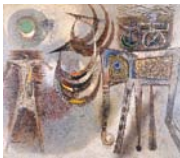
榎戸庄衛 「古代人の頭脳」 1958年

水戸市千波町東久保666の1 ☎029(243)5111 画9992 〈入館料〉一般600円、高・大生360円、小・中生240円