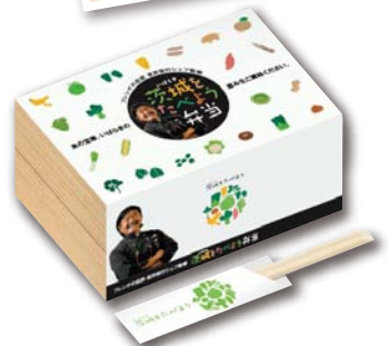
▲茨城をたべよう弁当 (イメージ)