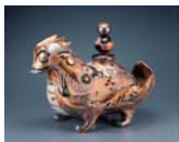
植葉香澄 「カメラ」 2008年

笠間市笠間2345(笠間芸術の森公園内) ☎0296(70)0011 画0012 〈入館料〉一般720円、高・大生510円、小・中生260円