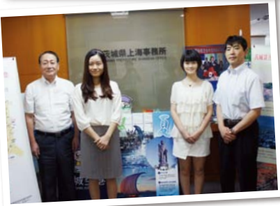
上海事務所のスタッフ