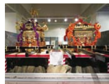
東金砂神社と 西金砂神社の神輿

坂東市大崎700 ☎0297(38)2000 画1999 〈入館料〉一般740円、高・大生450円、小・中生140円