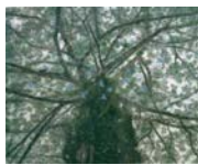
西野陽一「生命の樹」 2006年 東京オペラシティ アートギャラリー蔵

北茨城市大津町椿2083 ☎0293(46)5311 画5711 〈入館料〉一般620円、高・大生410円、小・中生210円