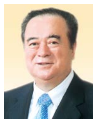
茨城県知事 橋本 昌