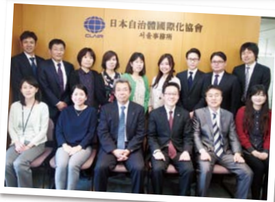
ソウル事務所のスタッフ