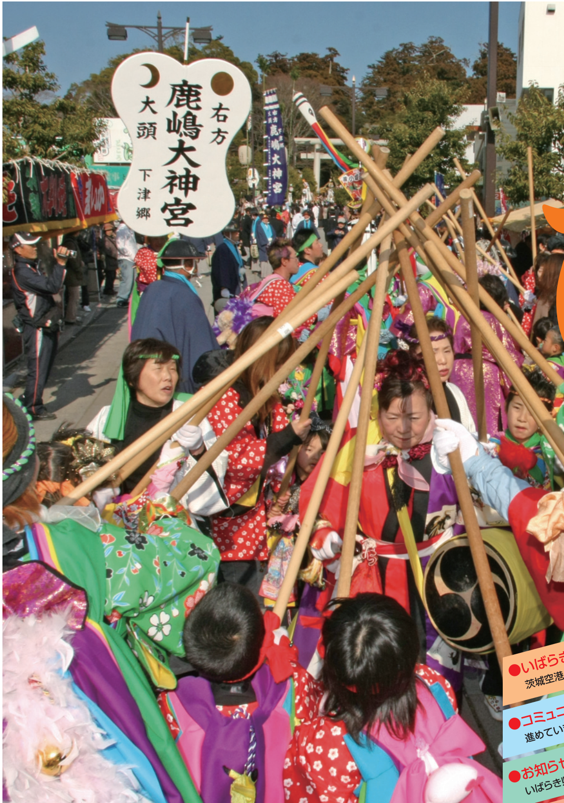
祭頭祭(3月9日・鹿島神宮) 鹿嶋市商工観光課 ☎0299(82)2911