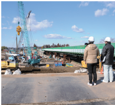
建設中の里川橋（常陸太田市）

問 県道路建設課 ☎029(301)4438 ㊟「復興みちづくりアクションプラン」で検索