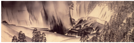
横山大観「生々流転」(部分) 重要文化財 1923年 東京国立近代美術館蔵

朝霞市 丸沼芸術の森所蔵 アンドリュー・ワイエス水彩・素描展 【同時開催】丸沼芸術の森アトリエの作家たち 3月27日(水)～5月19日(日)