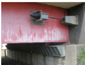
耐震化を進めた橋

耐震性の劣る橋梁や法面などの危険箇所の解消を優先的に進め、平成27年度までに特に重要なネットワークの箇所を、平成32年度までに全箇所の対策を完了させます。併せて、交通の妨げとなる箇所を改善します。