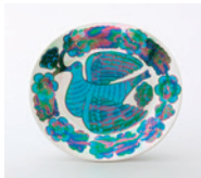
ビルガー・カイピアイン「オーバルプレート“バード”」1970年代

北欧を代表する陶磁器メーカー「アラビア窯」の初期からの作品約100点を展示します。