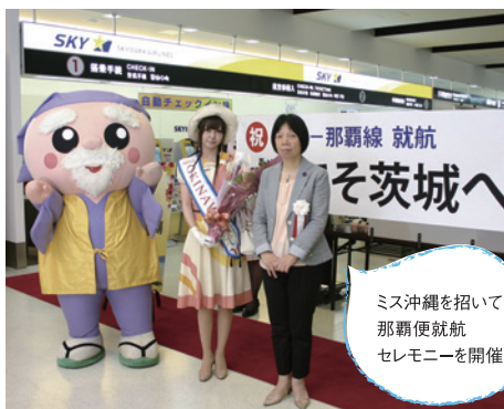
ミス沖縄を招いて 那覇便就航 セレモニーを開催