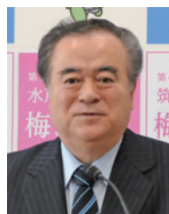
茨城県知事 橋本 昌