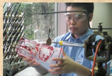
グラヴィール彫刻技法

水晶のように透明で美しいクリスタルガラスをご存知ですか。龍ヶ崎市にあるカガミクリスタルは、食器や花瓶など色鮮やかなクリスタルガラス製品を作り出す専門工場として知られています。