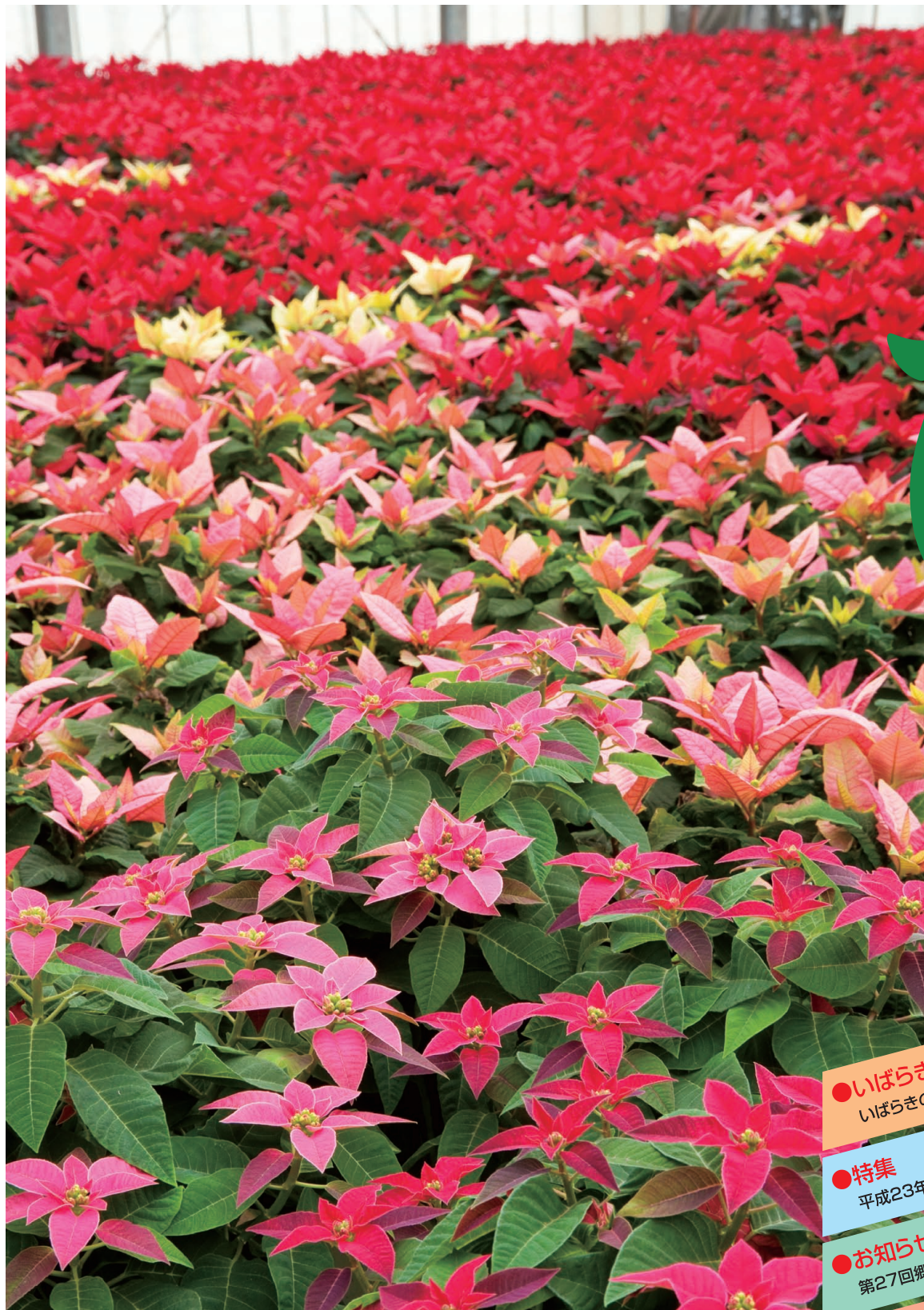
出荷の最盛期を迎えているポインセチア(手前は新品種「プリンセチア」 鉾田市)