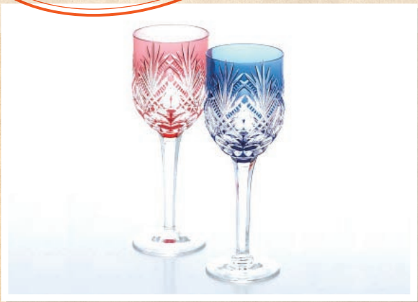
ペアワイングラス