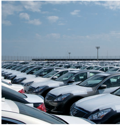
輸入された完成自動車

メルセデス・ベンツの日本の主な輸入拠点であり、日産自動車が栃木工場で生産する北米向け車両の輸出拠点。このように、完成自動車の流通拠点となっています。