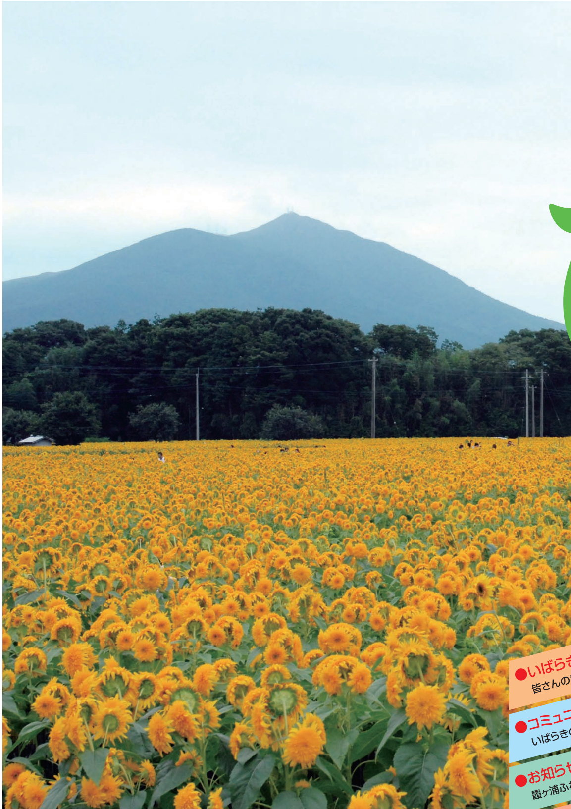
あけのひまわりフェスティバル(8月20日~28日)