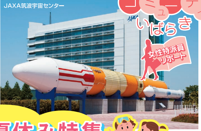
JAXA筑波宇宙センター