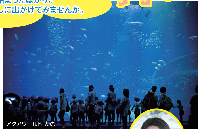
アクアワールド・大洗