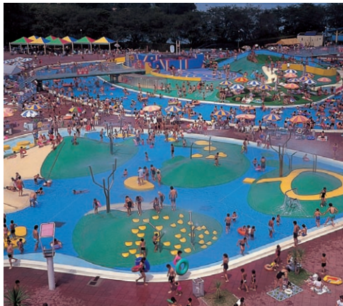
※営業期間9/4(日)まで。但し、9/1・2は休園。

そのほかにも、水の遊園地など人気スポット満載の「砂沼サンビーチ」へ、この夏ぜひ一度泳ぎに行ってみてはいかがでしょう。