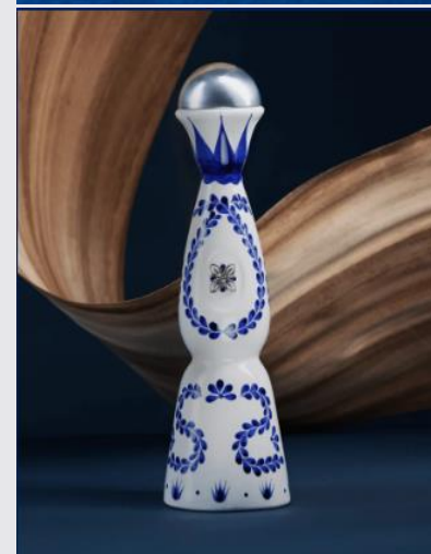
クラセアスール・テキーラ