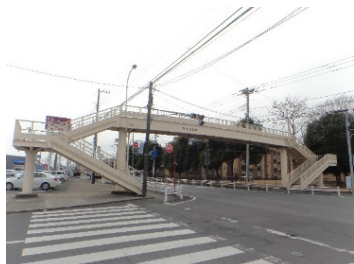
桂不動産 笠原歩道橋 (笠原歩道橋)