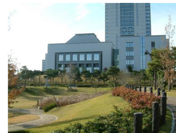
県庁東公園 SHIBA (県庁東公園)