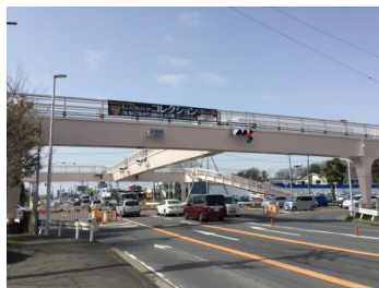
桂不動産 大角豆歩道橋 (大角豆歩道橋)