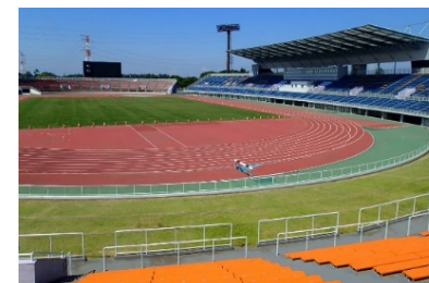
水戸信用金庫スタジアム (笠松運動公園 陸上競技場)