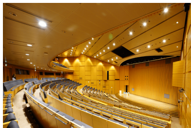
Leo Esaki メインホール (つくば国際会議場 大ホール)