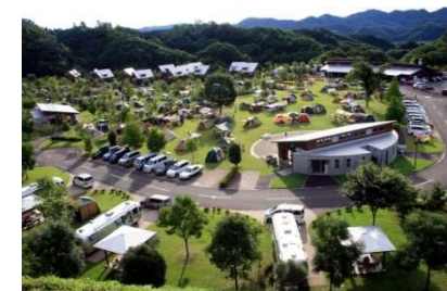
『大子広域公園オートキャンプ場 グリンヴィラ』