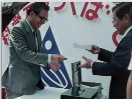
科学万博前売券販売開始