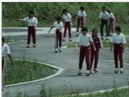
さしま少年自然の家で屋外研修