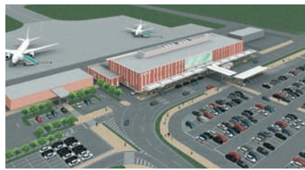
「茨城空港ターミナルビル完成予想図」