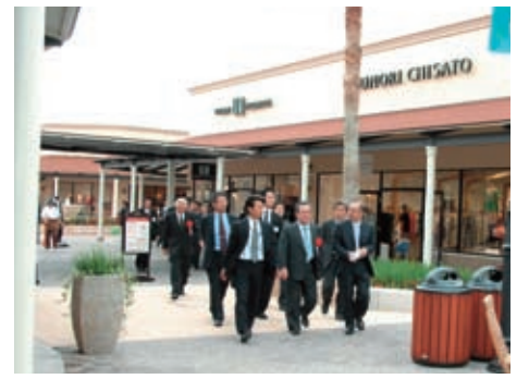
「あみプレミアム・アウトレットを視察」