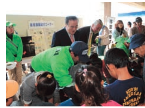
「子どもたちとふれあう橋本知事」