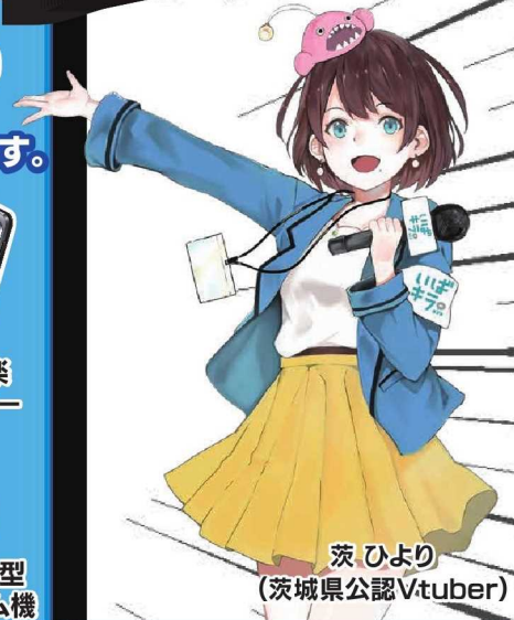
茨ひより (茨城県公認Vtuber)